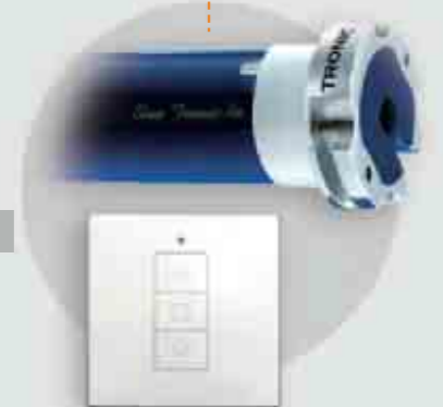
Blue Tronic RX Ø 35/45/58 pag. 26-46-70