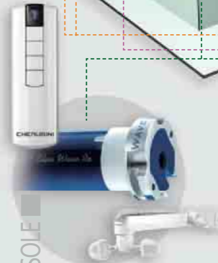
Blue Wave RX Ø 45/58 pag. 42-66