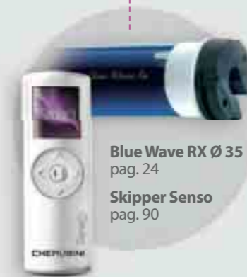
Blue Wave RX Ø 35 pag. 24